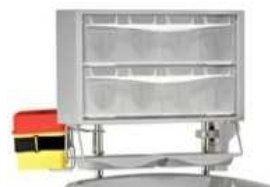
Nadstawka z dwoma rzędami uchylnych pojemników, dodatkowymi tacami oraz uniwersalnym uchwytem na pojemnik na igły