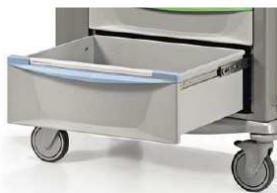
Szuflady wysuwane w 100%