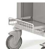
Półka na ssak zamontowana z lewej strony wózka