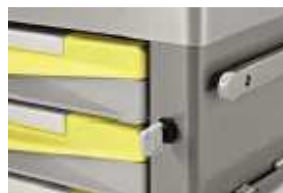
Centralna blokada szuflad na klucz