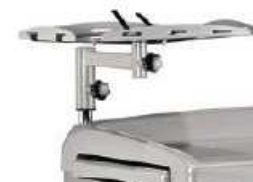
Półka na monitor lub defibrylator z pasami zabezpieczającymi