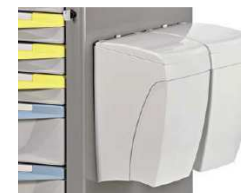
Dwa pojemnik na odpady otwierane kolanem, każdy o poj. 8l