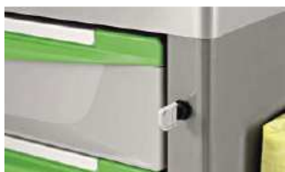
Centralna blokada szuflad na klucz