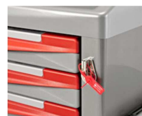
Centralna blokada szuflad za pomocą plomby