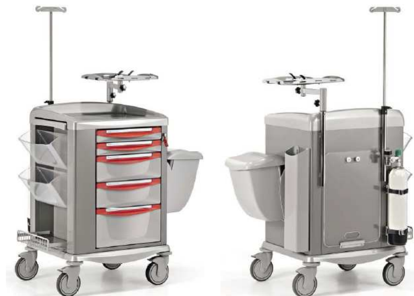
Model SWITCH 45, 9CS4221 EM

Wózek reanimacyjny standardowo jest wyposażony w: 5 szuflad (3 x 75 mm, 2 x 150 mm, 1 x 225 mm), centralną blokadę szuflad za pomocą plomby, wysuwany z boku dodatkowy blat, dwa uchylne pojemniki, półkę na pompę infuzyjną, półkę pod defibrylator lub monitor, wieszak kroplówki z regulacją wysokości, uchwyt na butlę tlenową, płytę reanimacyjną, pojemnik na cewniki, pojemnik na odpady o poj. 14l.