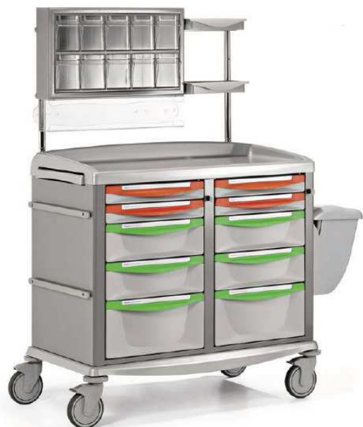
Model SWITCH 90, 9CS8221221

Wózek wielofunkcyjny standardowo jest wyposażony w: 10 szuflad (4 x 75 mm, 4 x 150 mm, 2 x 225 mm), centralną blokadę szuflad za pomocą klucza (każda kolumna szuflad zamykana niezależnie), wysuwany z boku dodatkowy blat, nadstawkę na akcesoria, zestaw 10 uchylnych pojemników, pojemnik na potrójny zestaw rękawic jednorazowych, dwie tace z tworzywa, dwie listwy na akcesoria 25x10 mm, pojemnik na odpady o poj. 14l.