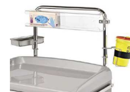
Nadstawka z pojemnikiem na pudełka z rękawiczkami jednorazowymi, uniwersalnym uchwytem na pojemnik na igły oraz pojemnikiem np. na narzędzia