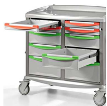
Szuflady w 100% wysuwane