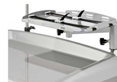
Półka na monitor lub defibrylator z pasami zabezpieczającymi