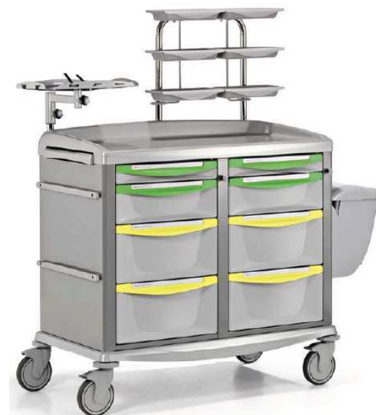
Model SWITCH 90, 9CS8112112

Stacja robocza standardowo jest wyposażona w: 8 szuflad (2 x 75 mm, 2x 150 mm, 4 x 225 mm), centralną blokadę szuflad za pomocą klucza (każda kolumna szuflad zamykana niezależnie), wysuwany z boku dodatkowy blat, nadstawkę z 6 tworzywowymi tacami, półkę na monitor lub defibrylator, dwie listwy na akcesoria 25x10 mm, pojemnik na odpady o poj. 14l.