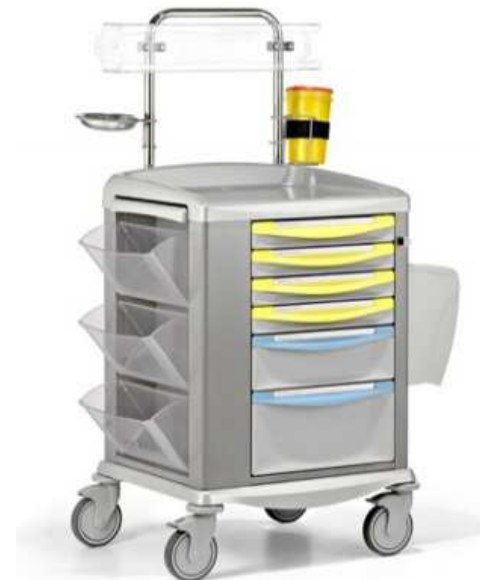
Model SWITCH 45, 9CS4411 TP

Wózek zabiegowy standardowo jest wyposażony w: 6 szuflad (4 x 75 mm, 1 x 150 mm, 1 x 225 mm), centralną blokadę szuflad za pomocą klucza, trzy uchylne pojemniki, wysuwany z boku dodatkowy blat, tubę na akcesoria, pojemnik na potrójny zestaw rękawic jednorazowych, uniwersalny uchwyt na pojemnik na igły, pojemnik ze stali nierdzewnej np. na narzędzia, dwa pojemniki na odpady – każdy o poj. 8l.