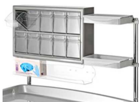
Nadstawka z dwoma 10 uchylnymi pojemnikami, pojemnik na pudełka z rękawiczkami jednorazowymi, dwie tace z tworzywa