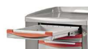
Szuflady wysuwane w 100%