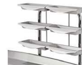
Nadstawka z 6 tworzywowymi tacami