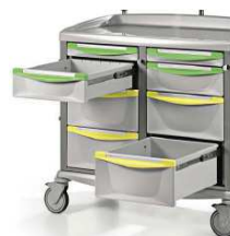
Szuflady w 100% wysuwane