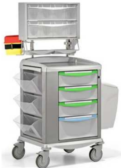
Model SWITCH 45, 9CS4031 MD

Wózek zabiegowy standardowo jest wyposażony w: 4 szuflady (3 x 150 mm, 1 x 225 mm), centralną blokadę szuflad za pomocą klucza, wysuwany z boku dodatkowy blat, trzy uchylne pojemniki, nadstawkę z 8 uchylnymi pojemnikami, dwie tworzywowe tace, otwieracz ampułek, uchwyt na pojemnik na igły, pojemnik na odpady o poj. 20l, matę ochronną na blat.