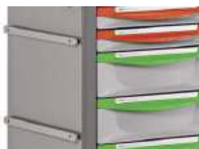
Dwie listwy na akcesoria 25x10 mm