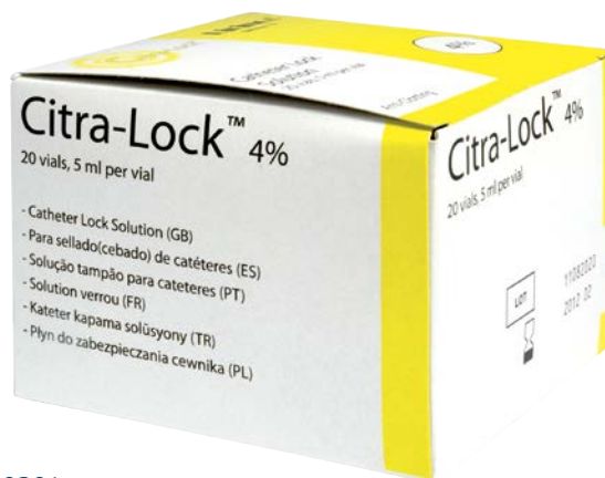
Pudełka zawierają 20 fiolek po 5 ml